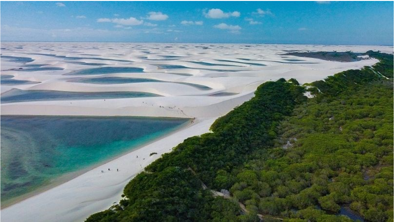
Park Nacional de Lençóis Maranhenses en Brasil Leo Castro

Plus de la moitié de ce parc national est formé par un champ de dunes blanches avec de petits lacs temporaires et permanents.