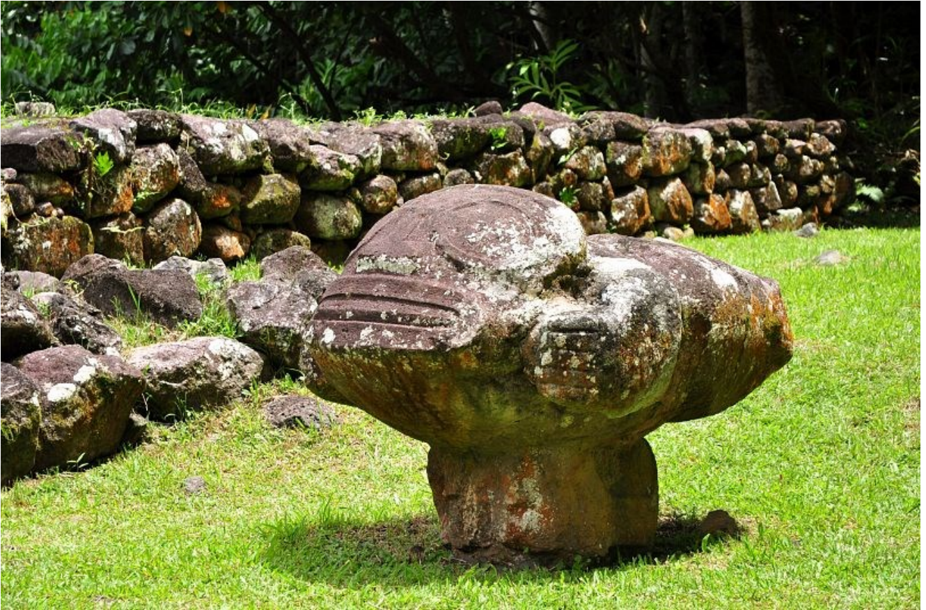
Te Henua Enata - Isles Marquises, France.

"Situada en el Pacífico Sur , esta propiedad mixta en serie es un testimonio excepcional de la ocupación territorial del archipiélago de las Marquesas por una civilización humana que llegó por mar hacia el año 1000 de nuestra era y se desarrolló en estas islas aisladas entre los siglos X y XIX", dice la lista.