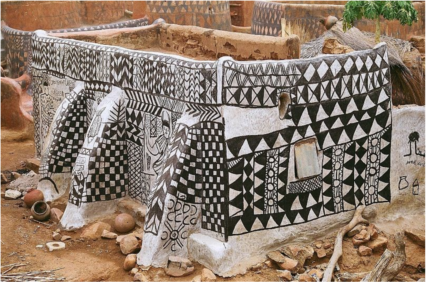
Cour Royal de Tiébélé en Burkina Faso.

"Le propriete es un complexe architectural de terre situed desde le siecle XVI que que done testimonie de le social organisacion et les valor cultural de le poble Kasena ",segun le UNESCO .