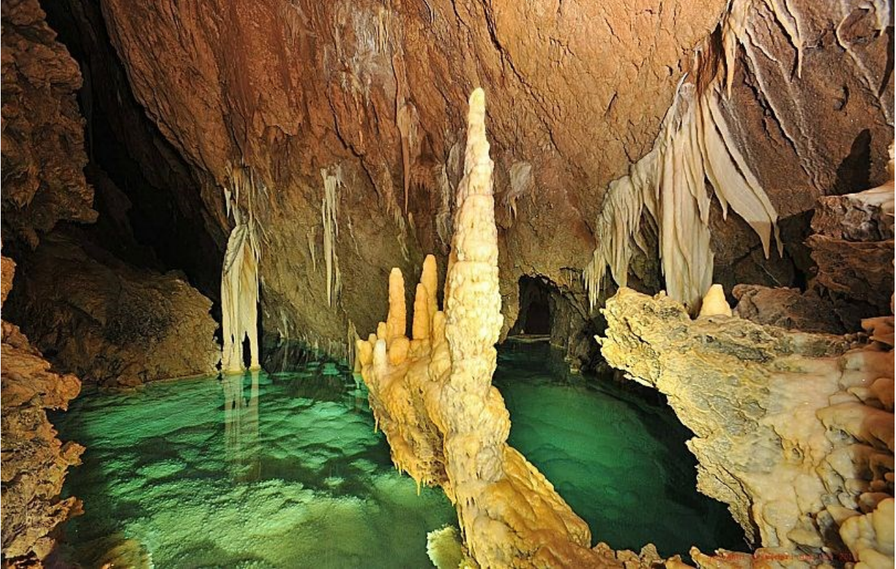
Cave de Vjetrenica, Bosnia et Herzegovina

"Situada en la cordillera de Dinarica, la propiedad resalta por su notable biodiversidad y endemismo de cuevas. Conocida desde antiguo, la bien conservada representación de la topografía karstik es uno de los puntos calientes de biodiversidad más importantes del mundo para la fauna cavernícola, en particular la fauna acuática subterránea", según la UNESCO.