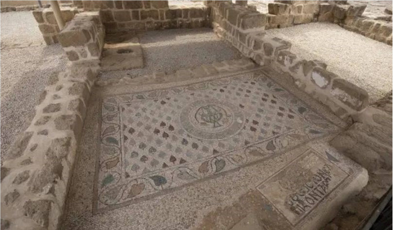
Monasterie de Sainte Hilarion/ Tell Umm Amer, Estado de Palestina.

"Situé en le dunes de le coast de le municipe de Nuseirat , las ruines de le monasterie de Saitn Hilarion/Tell Umm Amer represente un de le premieres sieges monastik de Oriente Proxime , de le siecle IV", deci le inscripcion de le UNESCO .