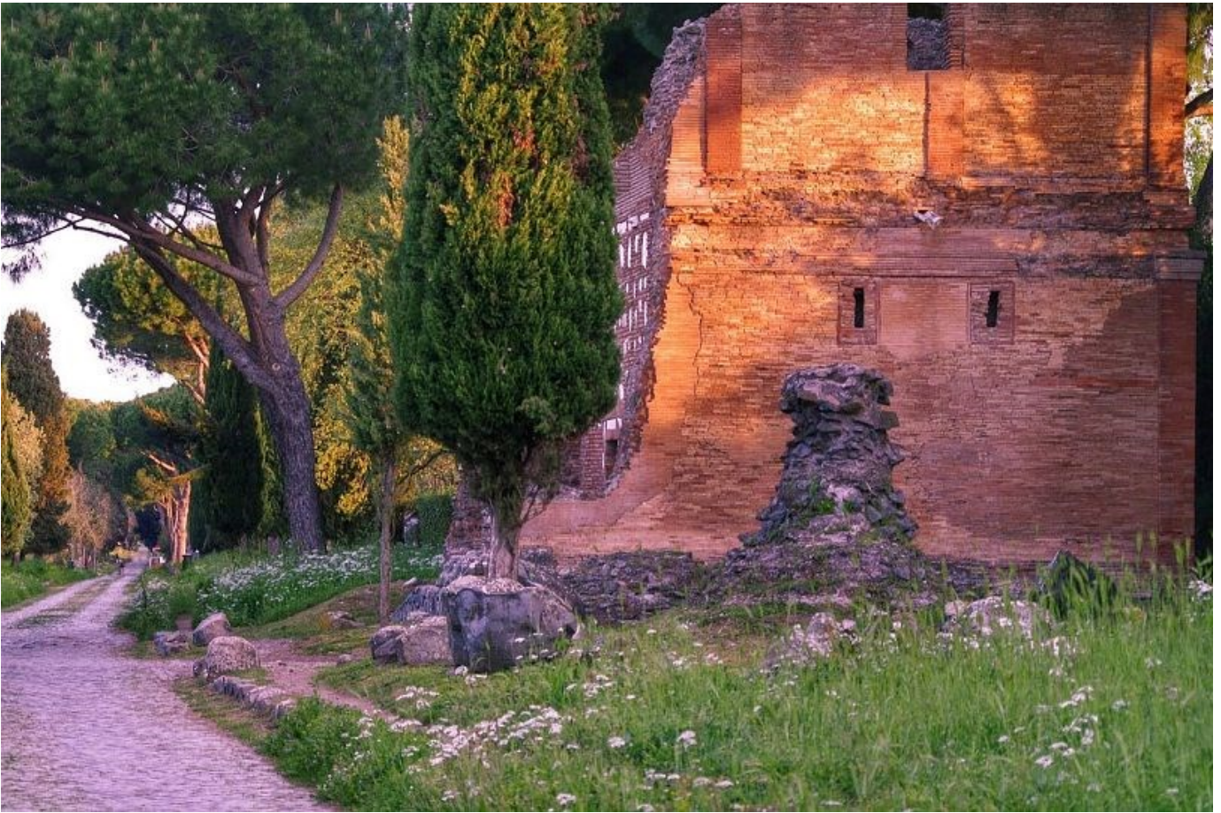
Vía Apia, Italia

Con plus de 800 kilometres de longitude, le Via Apia es le plus antic et, plus importante de le vias monumental construid por le antic romanes.