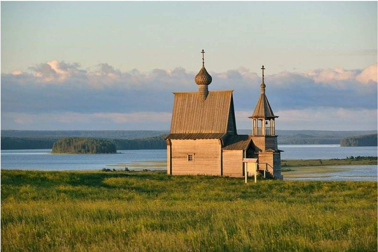
Paysage culturel de le lac Kenozero, en Rusie.

Inicié en le siècle XII tras le colonización eslave, le cultural paysage de le lac de Kenozero comprende sieges rural de structures propies de madera et "reflecte le gestion comun de le agriculture et le nature que sabe developé quand le culture forestal autochtone finougria sabe fusionné con le culture traditionnelle eslave de le champ".