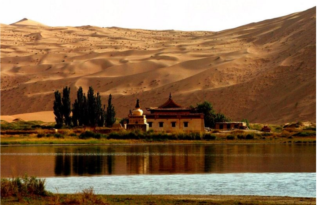
Desert de Badain Jaran, China

Le UNESCO nome le tercer desert plus grande de China por sue "alte densite de megadunes, entre lakes interdunal".